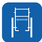
Largeur d'assise ▼

Pour plus de renseignements, rendez-vous sur notre site internet www.invacare.be/fr . Retrouvez-y le manuel d'utilisation ainsi que toutes les informations liées à ce produit.