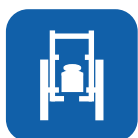
Poids du fauteuil ▼