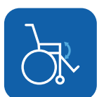
Bascule d'assise ▼