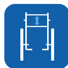
Hauteur de dossier ▼