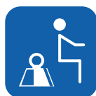
Poids max. utilisateur ▼