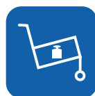
Poids de transport ▼